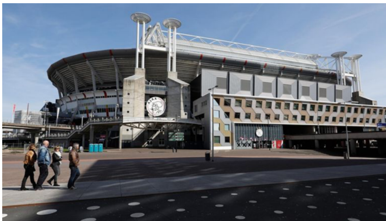
De Johan Cruïjff Arena